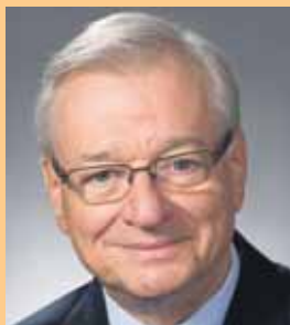
Gilles Vaillancourt Maire de Laval

J'aimerais féliciter tous les lauréats, finalistes et partenaires pour leur participation à cette 30 e édition du Gala Dunamis ainsi que pour leur engagement indéfectible à la réalisation du succès lavallois.